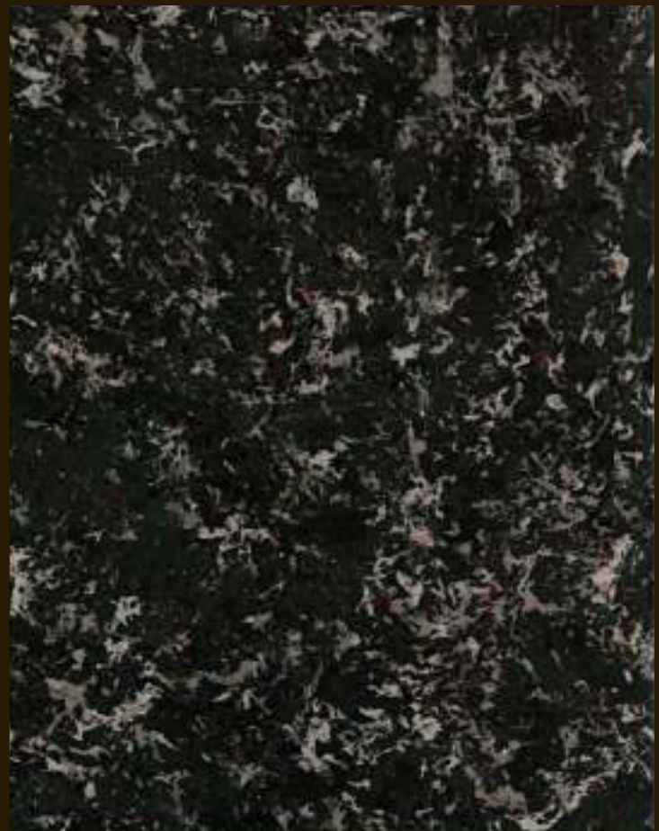
NERO AFRICA IMPALA