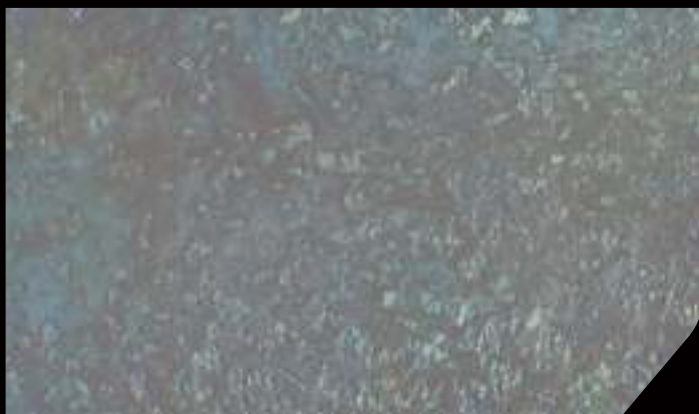
BASE: DECORDEK BIANCO - FINISH: 1 DT96 in 750 ml VELE' +1 DT93 in 750 ml VELE' ARGENTO