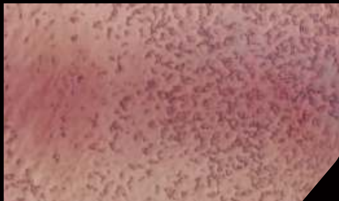
BASE: DECORDEK BIANCO - FINISH: - 1 DT97 in 750 ml VELE' + 1 DT14 in 750 ml VELE' ARGENTO + 2/3 DT21 in 750 ml VELE' ARGENTO