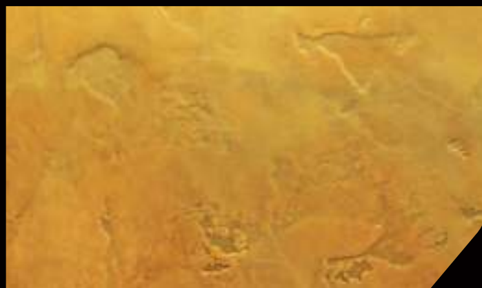
BASE: 1 DTX06 IN 4l DECORDEK FINISH: 1 DT21 IN 750 ml VELE' + VELE' ORO