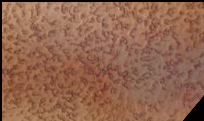
BASE: 1 DT88 in 4 lt DECORDEK FINISH: 1/3 DTX04 IN 750 ML VELE' ARGENTO