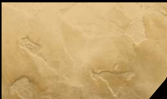
BASE: 1 DTX06 in 4 lt DECORDEK FINISH: SHADE' L BRONZO