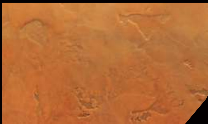
BASE: 1 DTX07 in 4 lt DECORDEK FINISH: 1 DT21 in 750 ml VELE' + VELE' ORO