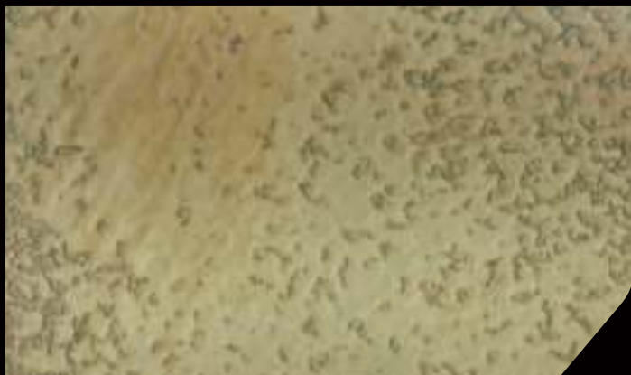
BASE: DECORDEK BIANCO FINISH: 1 DT88 in 750 ml VELE. + 2/3 DT05 in 750 ml VELE' ORO