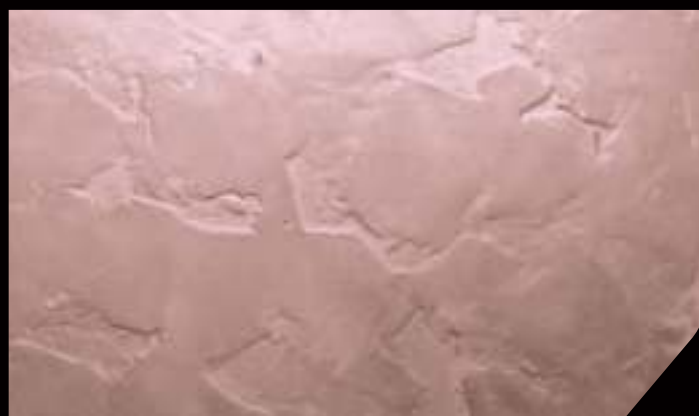
BASE: 1 DT21 in 4 lt DECORDEK - FINISH: 1 DT25 in 750 ml VELE' ARGENTO+ 1 DT21 in 750 ml VELE' ARGENTO