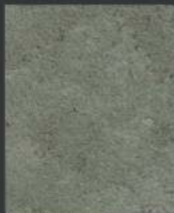
1 DT ORO in 1 DT 05 750 ml di Athelié