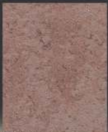
1 DT ORO in 1 DT 14 750 ml di Athelié