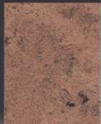
1 DT ORO in 1/3 DT 18 750 ml di Athelié