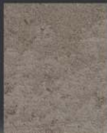
1 DT ORO in 1 DT 15 750 ml di Athelié