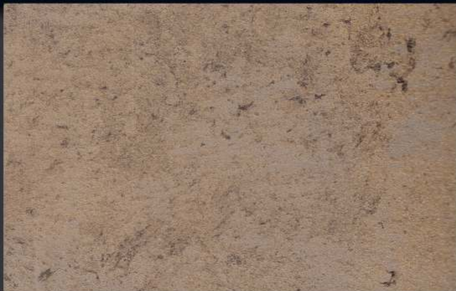
1 DT ORO in 750 ml di Athelié

Finitura decorativa per un moderno effetto anticato Decorative finish with a contemporary antique effect Peinture decorative antique pour un effet contemporain