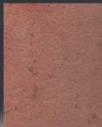
1 DT ORO in 1 DT 18 750 ml di Athelié

Tinte più tenui o più forti con differenti aggiunte di TINTER - Stronger or paler shades can be made by adding more or less "TINTER"