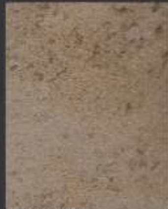
1 DT ORO in 1 DT 06 750 ml di Athelié