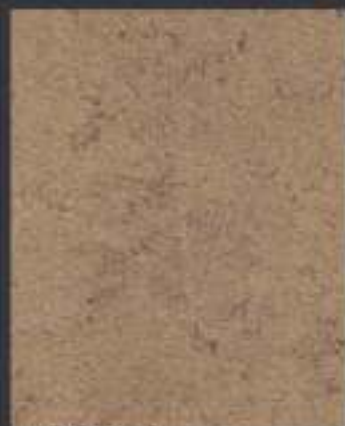
1 DT ORO in 1 DT 02 750 ml di Athelié