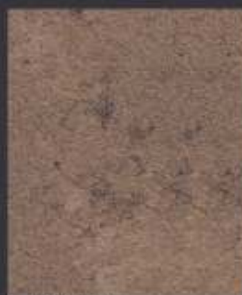
1 DT ORO in 1 DT 01 750 ml di Athelié